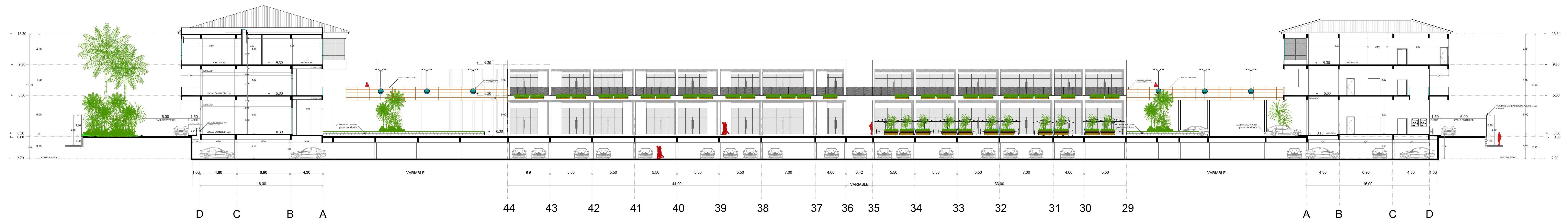
PROYECTO ARQUITECTÓNICO CORTE E-E' ESCALA 1-200