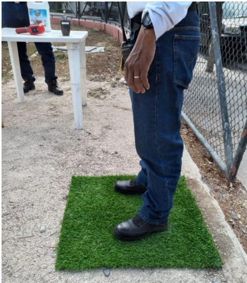
DESINFECCIÓN DE ZAPATOS