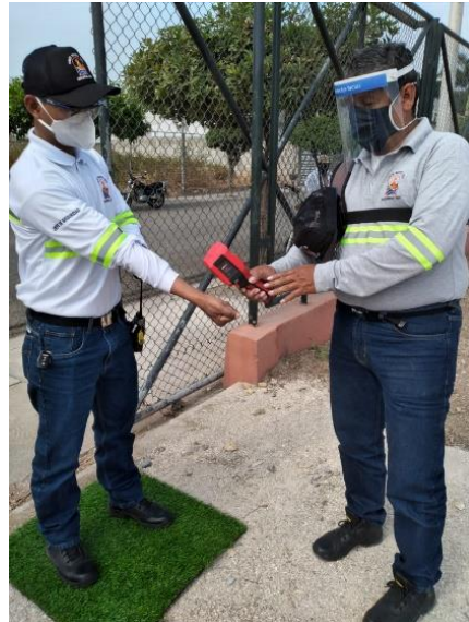
CONTROL DE TEMPERATURA