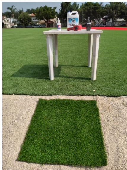
PUESTO DE DESINFECCIÓN